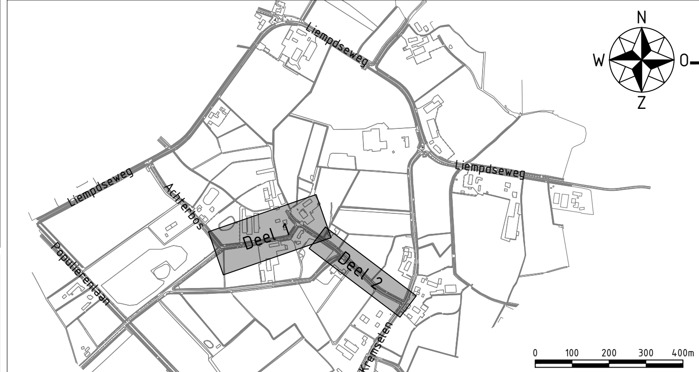
Overzichtskaart Bus Schaal 1:10000

Maten in meters, tenzij anders vermeld. Materiaalmaten in mm, tenzij anders vermeld. Peilmaten in meters f.o.v. N.A.P., tenzij anders vermeld. Diameters in mm, tenzij anders vermeld.